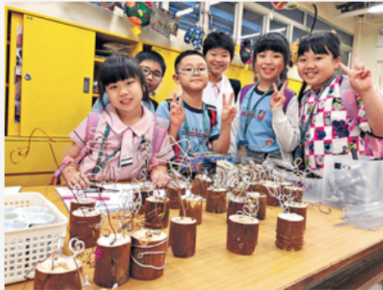
▲ 播善蜂入校教授鐵綫雕塑。學生先繪畫出自己喜歡的圖案，再嘗試以鐵綫製成雕塑。