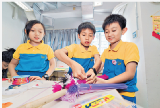
▲ 學生從日常生活用品中學習觀察、搜集資料和討論，最後設計作品。