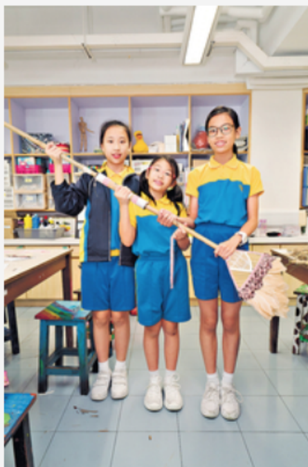
▲ 學生設計給小矮人掃煙囪用的掃把，特別加長掃把柄及掃把頭用輕身物料製作。